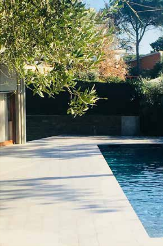
04_Capoza - Voluta.jpg