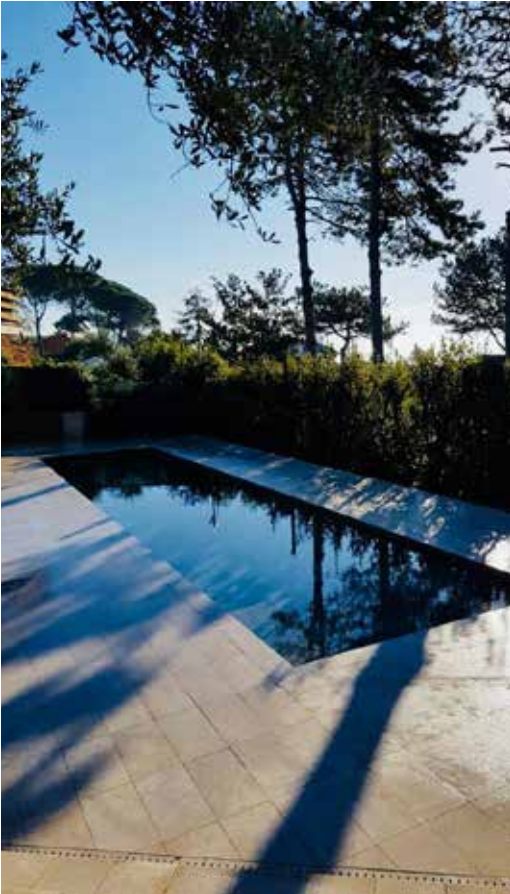
01_Capozza - Voluta.jpg