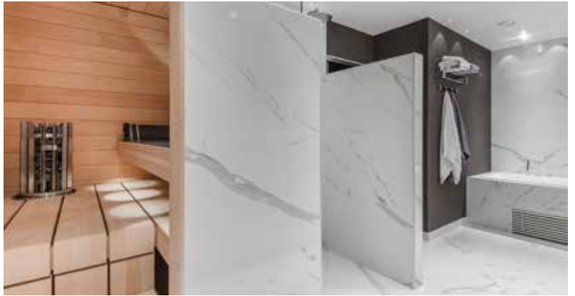
05_Birgitta_Hjelm-Luontola.jpg / 06_Birgitta_Hjelm-Luontola.jpg