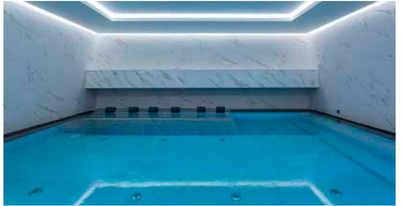
05_Cipiuelle.jpg / 06_Cipiuelle.jpg