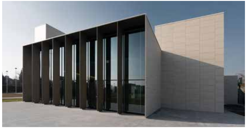
05_Filippo_Taidelli.jpg / 06_Filippo_Taidelli.jpg