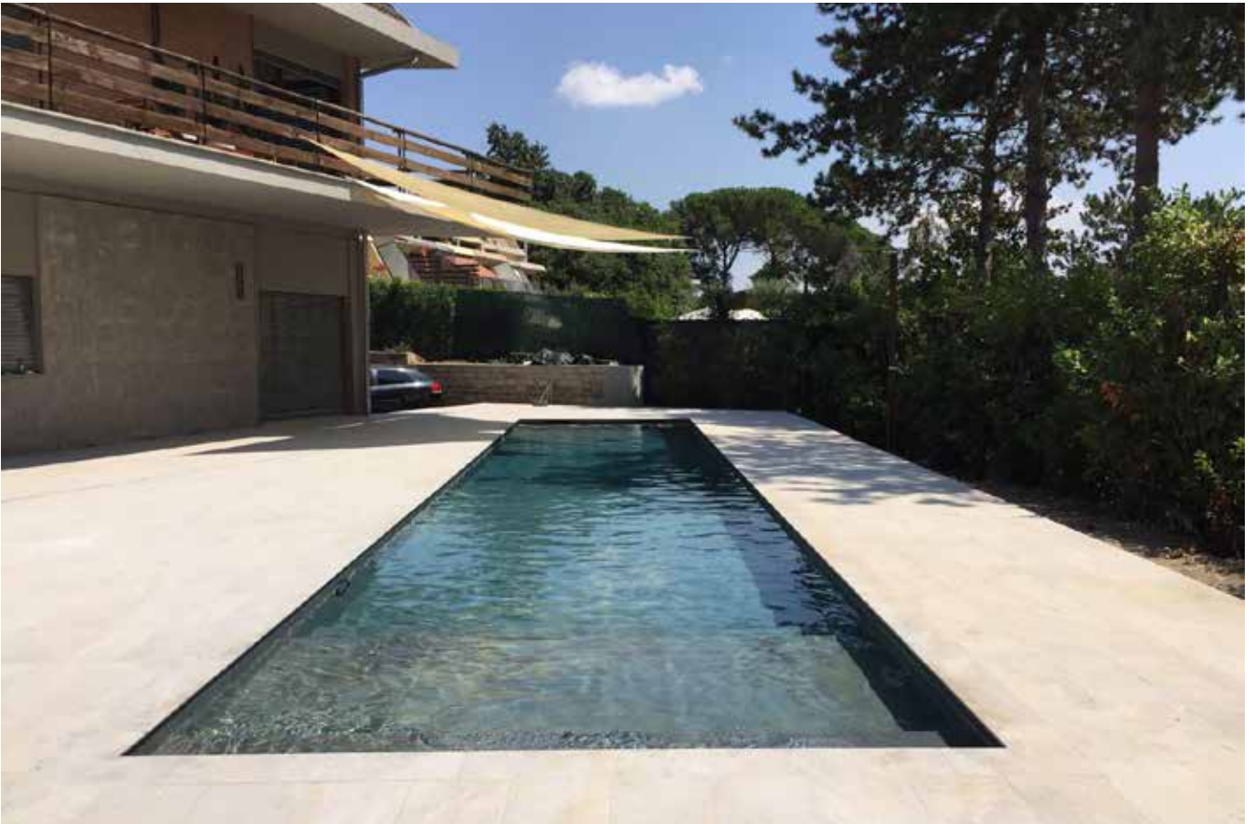
07_Capoza - Voluta.jpg