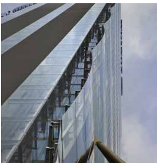
02_Isozaki - Maffei.jpg

L'idée de tour sans fin à la base du gratte-ciel milanais, système modulaire se répétant à l'infini vers le ciel, se retrouve à tous les étages grâce aux espaces définis des lobbys et des paliers d'ascenseur, le tout rythmé par le blanc absolu. Le matériau céramique permet ainsi de définir les atmosphères suspendues d'espaces quasiment abstraits, défiant la lumière extérieure et se répétant, sans fin, selon le programme conceptuel de la tour qui les accueille.