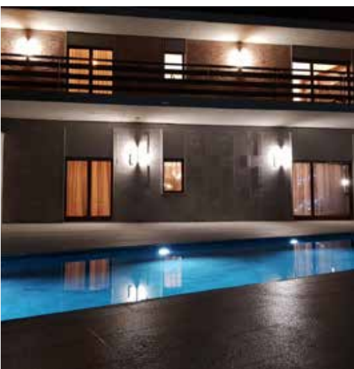
02_Capozza - Voluta.jpg

La piscine vient s'ajouter à l'espace domestique de la maison comme un élément en plein air composé d'un seul matériau qui se décline en deux couleurs différentes. Les murs du bassin sont recouverts de dalles de couleur noire tandis que le fond est de couleur ocre. Les deux parties sont raccordées d'un côté au relief du paysage par des marches recouvertes du même matériau, créant ainsi une seule forme harmonieuse.