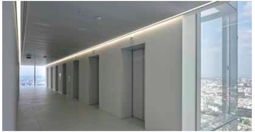
05_Isozaki - Maffei.jpg / 06_Isozaki - Maffei.jpg