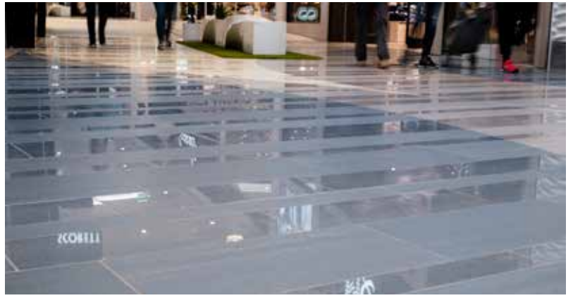
© Photos: Linnsej Photography 05_Josefine_Dahl.jpg / 06_Josefine_Dahl.jpg