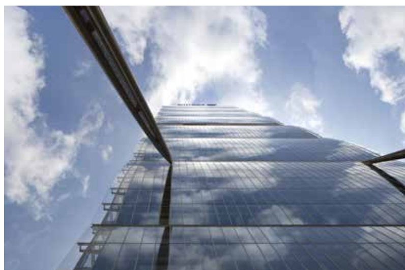
03_Isozaki - Maffei.jpg