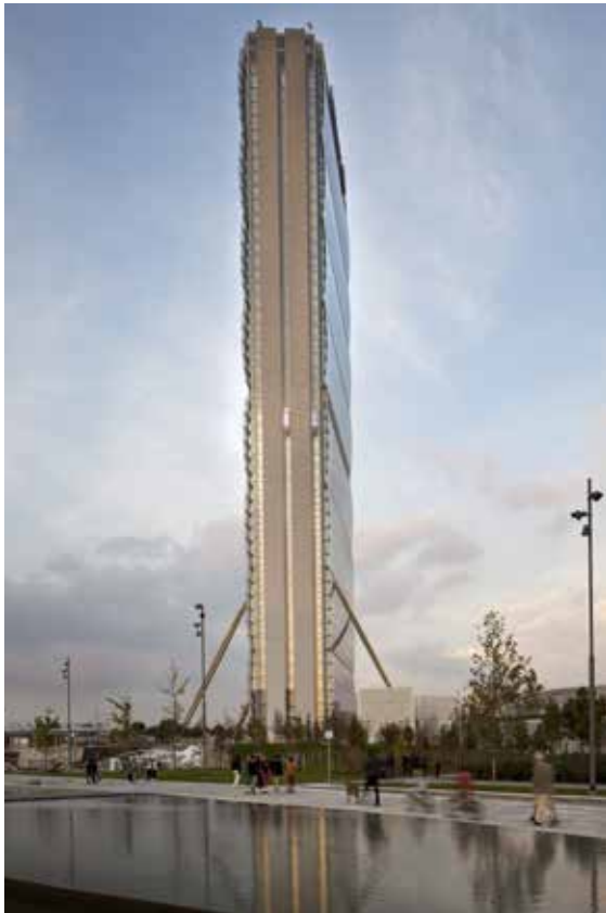
04_Isozaki - Maffei.jpg