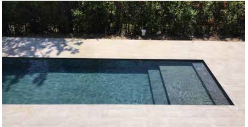
05_Capoza - Voluta.jpg / 06_Capoza - Voluta.jpg