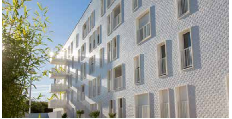
05_Pietri_Architects.jpg / 06_Pietri_Architects.jpg