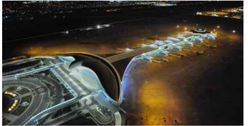
05_Erol_Tabanca.jpg / 06_Erol_Tabanca.jpg