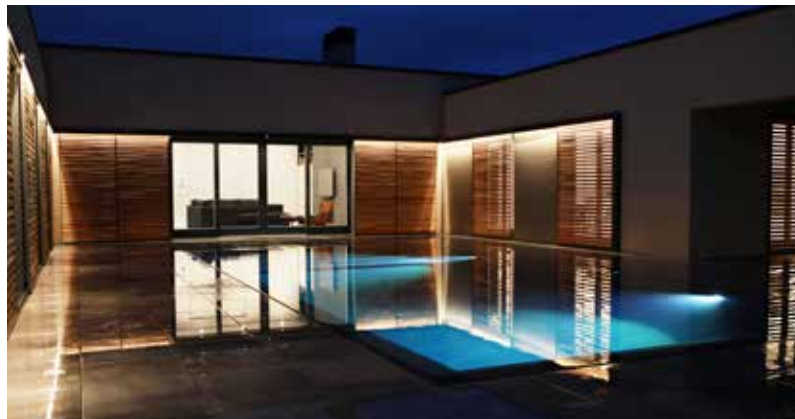
05_Ardea_Collective.jpg / 06_Ardea_Collective.jpg