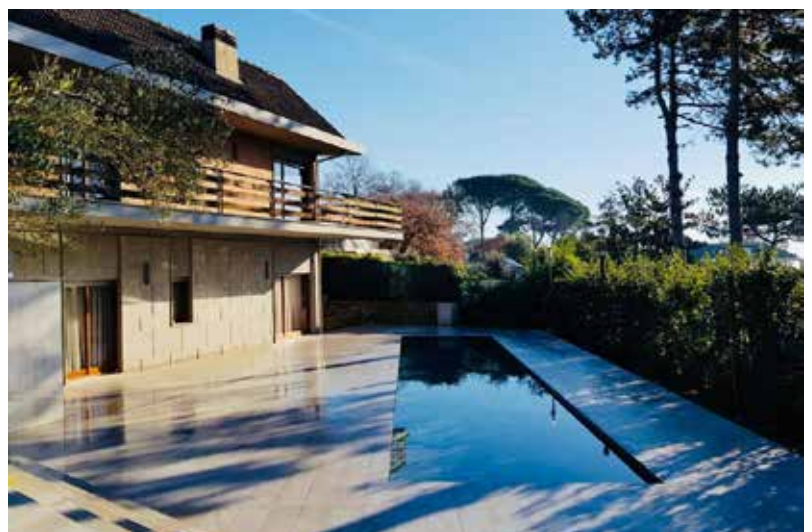
03_Capozza - Voluta.jpg